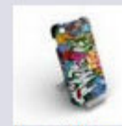
Cover iPhone 4 Vaveliero