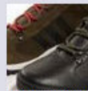
Adidas Originals Autunno 2011