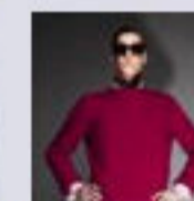
Scarpa Be Positive Tom Ford Autunno 2011