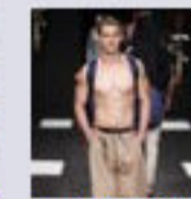
Frankie Morello Ss 2012